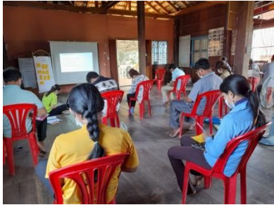
Picture 11: ការបណ្តុះបណ្តាលក្រុមយុវជន ពីការកសាង និងគ្រប់គ្រងគម្រោង

បានផ្តល់ វគ្គបណ្តុះបណ្តាលស្តីពីការកសាងគម្រោង និងការ គ្រប់គ្រងគម្រោងដល់យុវជនសរុបចំនួន៨នាក់ ស្រី៤នាក់ មកពី ភូមិបឹងចំនួន២នាក់ ស្រី០នាក់ ភូមិសន្តងជ័យចំនួន២នាក់ ស្រី២ ភូមិទន្លាប់ចំនួន២នាក់ ស្រី១ និងភូមិឫស្សីស្រុកចំនួន២នាក់ ស្រី១