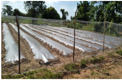
Picture 5 : ការធ្វើចំការបង្ហាញ

កសិដ្ឋានកសិករគំរូដាំបន្លែ ពាក់កណ្តាលអាជីព ត្រូវបានរៀបចំ ចំនួន៥គ្រួសារ ក្នុងនោះមានកសិករឆ្នាំ២០១៩មាន១គ្រួសារ, ២០២០មាន២គ្រួសារ និង២០២១មាន២គ្រួសារ។