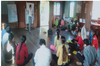
Picture 2: សកម្មភាព COP

ប្រជុំត្រីមាសក្រុមកសិករ(COP) ៣លើក (ថ្នាក់ភូមិ១លើក និងថ្នាក់ស្រុក២លើក)។ ថ្នាក់ភូមិ ប្រជុំកសិករភូមិសំបូរ និងភូមិជោគជ័យ មានអ្នកចូលរួមសរុបចំនួន៣៦នាក់ ស្រី២៧នាក់ (ចិញ្ចឹមមាន់មានចំនួន២៧នាក់ ស្រី២២នាក់ និងដាំបន្លែមានចំនួន៩នាក់ ស្រី៥នាក់។