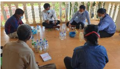
Picture 23: ជនបង្គោល និងបុគ្គលិក ទទួលបានវគ្គបណ្តុះបណ្តាលពីរបៀបប្រើ(PHs & SOEK)

ក្រោយវគ្គ បណ្តុះបណ្តាល បានបង្ហាញអោយឃើញថា៖ មុនវគ្គល្អមាន ៥ % មធ្យម ៦ % និងខ្សោយ ៨៩ % នៃអ្នកចូលរួម។ក្រោយវគ្គល្អ៧៤ %មធ្យម ២៤ %និង ខ្សោយ២ %។