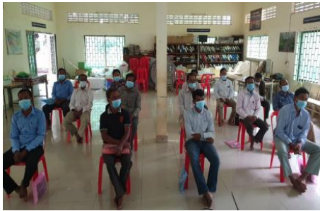
Picture 21: ផ្តល់វគ្គបណ្តុះបណ្តាលដល់អាជ្ញាធរ EIA

• អាជ្ញាធរ ចំនួន ២៥ នាក់ ស្រី ចំនួន ៤ នាក់ (មេភូមិ ក្រុមប្រឹក្សាឃុំ) នៅឃុំពុទ្រា ឃុំស្អាង និងតស៊ូ ទទួលបាន វគ្គបណ្តុះបណ្តាលពីការវាយតម្លៃពីផលប៉ះពាល់បរិស្ថាន និងសង្គមដែលសម្របសម្រួលដោយមន្ទីរបរិស្ថាន មានរយៈពេល ២ ថ្ងៃ។ លទ្ធផលមុននិងក្រោយវគ្គបណ្តុះបណ្តាល: មុនវគ្គល្អ មាន ៣០ % មធ្យម និងខ្សោយ ៧០ % នៃអ្នកចូលរួម។ ក្រោយវគ្គ ល្អ ៩៣ % និងខ្សោយ ៧ %។