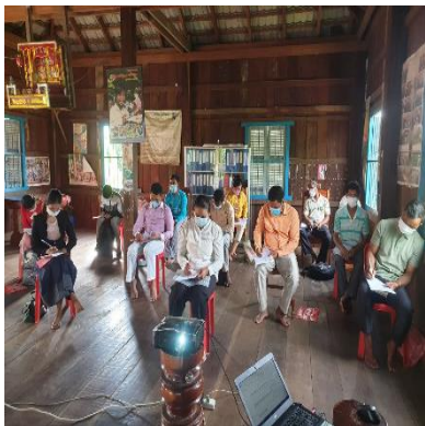
Picture 25: ផ្តល់វគ្គបណ្តុះបណ្តាលកម្រិតបច្ចេកវិទ្យាដល់លោកគ្រូ អ្នកគ្រូ

អនុវិទ្យាល័យចំនួន ៤ មានអនុវិទ្យាល័យត្រពាំងទន្ទឹម ផ្តល់កោងរស្មី រីករាយ និងរូសរាន់ ដើម្បីផ្តល់វគ្គបណ្តុះបណ្តាលដល់លោកគ្រូ អ្នកគ្រូពីរបៀបប្រើប្រាស់បច្ចេកវិទ្យាតាមប្រព័ន្ធ Online ( Google Meet & Messenger Room) មានលោកគ្រូ អ្នកគ្រូចូលរួមសរុប ១៦ នាក់ ស្រី ចំនួន ៨ នាក់។ យោងតាមលទ្ធផលមុន និងក្រោយវគ្គឃើញថា៖ មុនវគ្គ ១៨ % មានការយល់ដឹងបានល្អ ៣២ % មធ្យម និង ៥០ % ខ្សោយ។ ក្រោយវគ្គ៖ ៨៧ % មានការ យល់ដឹងបានល្អ ១៣% ទទួលបាន មធ្យម និង ០ % ខ្សោយ។