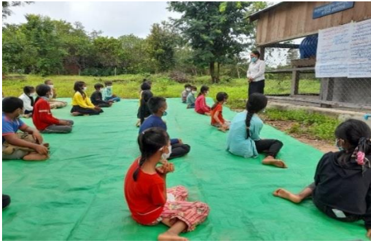
Picture 17: ទិវាសិទ្ធិកុមារ