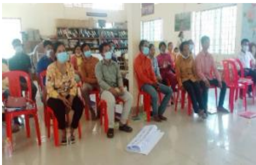
Picture 22: ផ្តល់វគ្គបណ្តុះបណ្តាលដល់ជនបង្គោលពី ជំនាញសម្របសម្រួល FPIC

• អាជ្ញាធរ ចំនួន ២៥ នាក់ ស្រី ចំនួន ៤ នាក់ (មេភូមិ ក្រុមប្រឹក្សាឃុំ) នៅឃុំពុទ្រា ឃុំស្អាង និងតស៊ូ ទទួលបាន វគ្គបណ្តុះបណ្តាលពីការវាយតម្លៃពីផលប៉ះពាល់បរិស្ថាន និងសង្គមដែលសម្របសម្រួលដោយមន្ទីរបរិស្ថាន មានរយៈពេល ២ ថ្ងៃ។ លទ្ធផលមុននិងក្រោយវគ្គបណ្តុះបណ្តាល: មុនវគ្គល្អ មាន ៣០ % មធ្យម និងខ្សោយ ៧០ % នៃអ្នកចូលរួម។ ក្រោយវគ្គ ល្អ ៩៣ % និងខ្សោយ ៧ %។