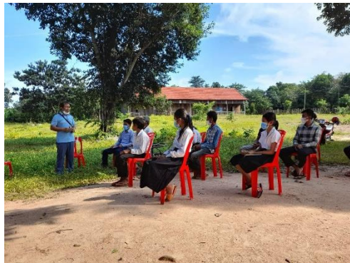
Picture 16: ការិយាល័យអប់រំចុះពិនិត្យមើលការរៀន និងបង្រៀន

គាំទ្រមន្ត្រីការិយាល័យអប់រំស្រុករៀង និងប្រធានកម្រងចូលរួមប្រជុំគណៈកម្មការទ្រទ្រង់សាលា ទាំង៤ ដែលមានមន្ត្រីការិយាល័យអប់រំស្រុករៀង ចំនួន១នាក់ ស្រី០ និងប្រធានកម្រងតាមសាលាទាំង៤។លទ្ធផលមន្ត្រីការិយាល័យអប់រំស្រុករៀង និងប្រធានគម្រោង