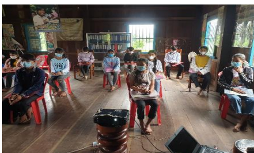
Picture 24: ផ្តល់វគ្គបណ្តុះបណ្តាលពីរបៀបប្រើ Online ដល់សិស្សអនុវិទ្យាល័យ

ឃើញថា៧៥ % នៃអ្នកចូលរួមមានការយល់ដឹងបានល្អ និង ២៥ % មធ្យម។