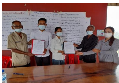
Picture 10: ការចុះកិច្ចព្រមព្រៀងរវាងក្រុមយុវជន និង NTFP នៅឃុំរួសរ៉ាន់

. ការរៀបចំចុះកិច្ចព្រមព្រៀងលើគម្រោងសំណើ របស់ យុវជន មានអ្នកចូលរួមចំនួន១០នាក់ ស្រី២នាក់។ គម្រោង យុវជន នៅភូមិ ប្តីស្រីស្រុក ធ្វើលើការសាង សង់បង្គន់ អនាម័យ ដែលមាន ការ